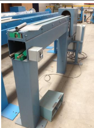
Motorische Wulstmaschine 1 m