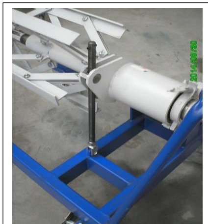
Einseitig nicht angetriebenes Abwickelgerät