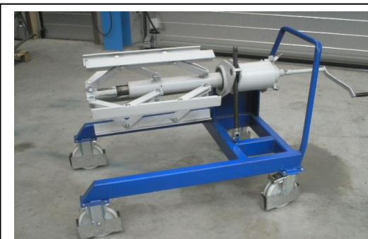
Einseitig nicht angetriebenes Abwickelgerät