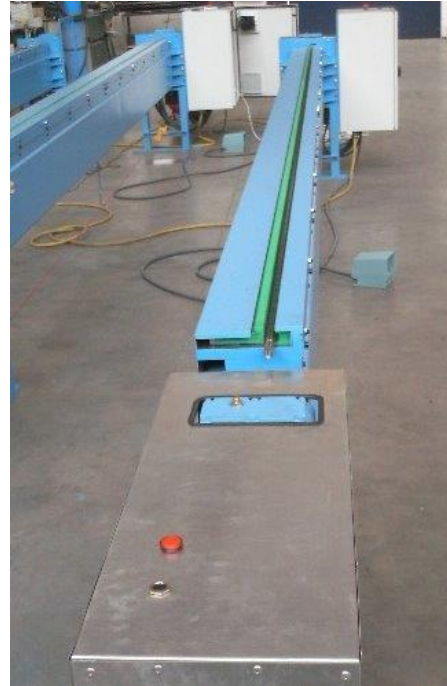
Wulstmaschine DAC 6000 mm