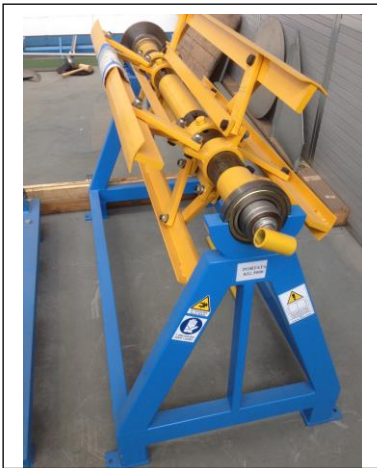
Nicht angetriebenes Abwickelgerät