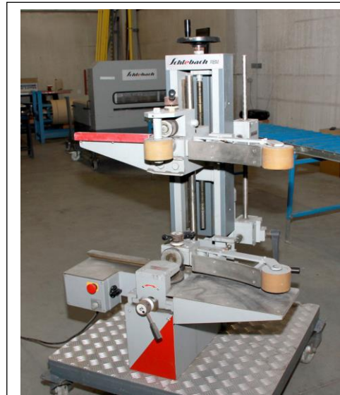
Rundbiegemaschine für Stehfalz