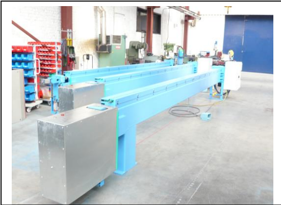
Wulstmaschine DAC type BMOPP 6000