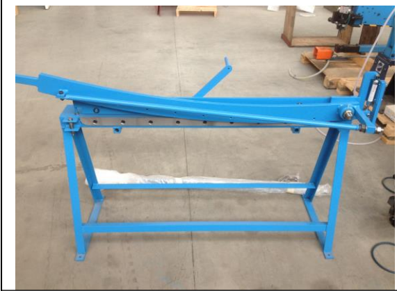
Manuele slagschaar voor zink en koper