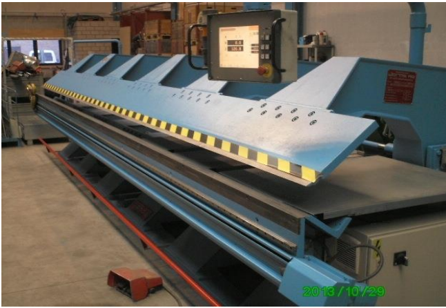
JORNS ML200-SW-RH-SM3-CNC500-6 Occasie vouwbank