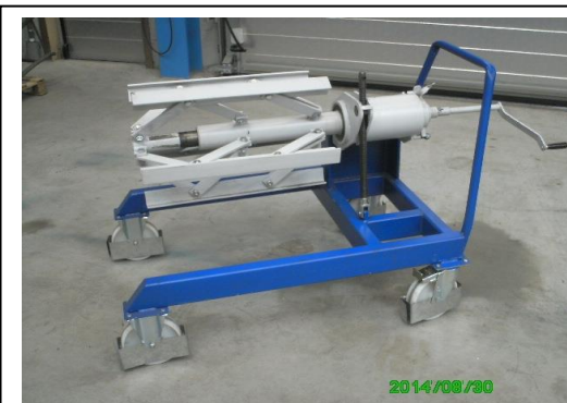
Niet aangedr. haspel open aan een kant