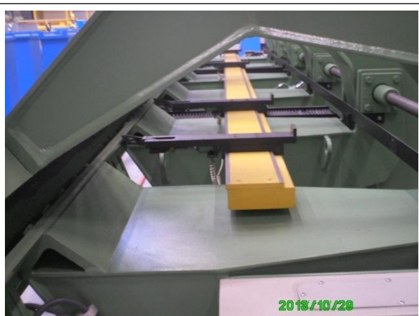
Achteraanslag en aanslagvingers