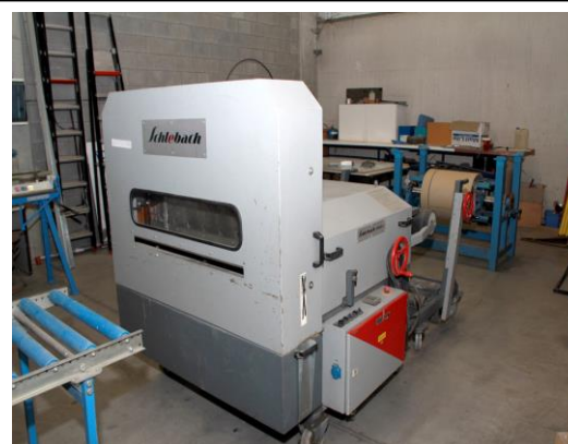
Occasie Profileermachine Schleich