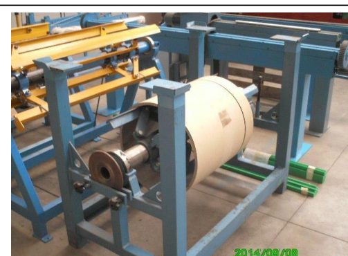
Niet aangedreven stapelbare haspel