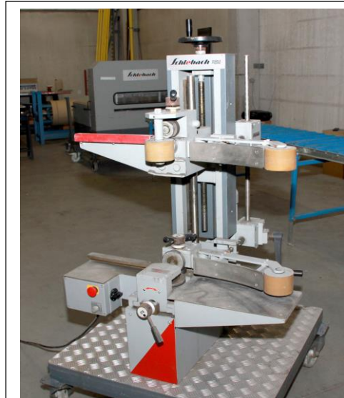
Rondbuigmachine Schleich voor staande naad profielen