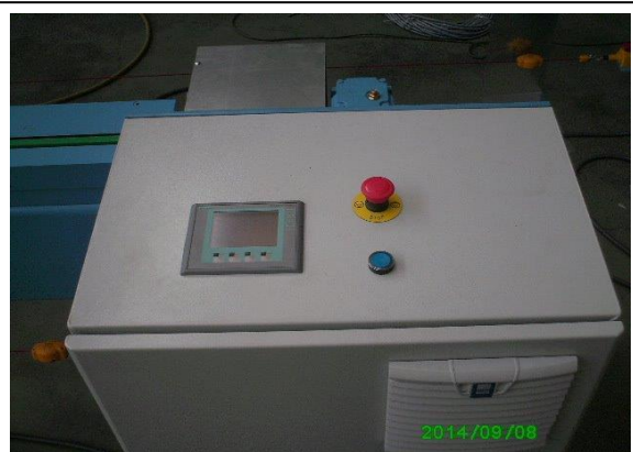
Elektrische kast met aanraakscherm