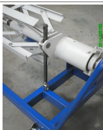
Niet aangedreven haspel Open aan een kant