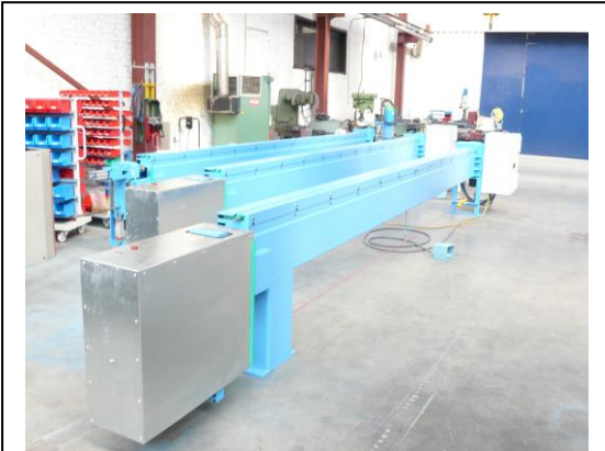
Kraalmachine DAC type BMOPP 6000