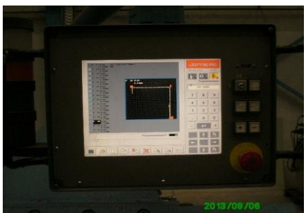
CNC 500 grafische sturing met aanraakscherm