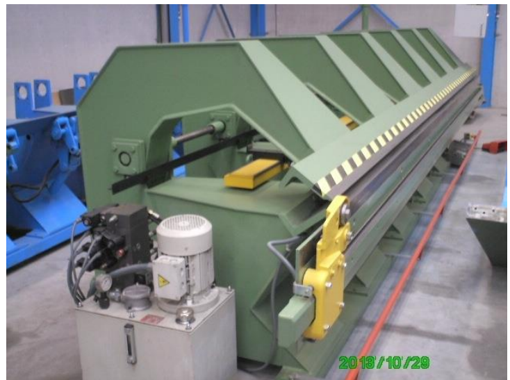
JORNS ML200-SW-RH-SM-PC4000-6 Occasie vouwbank gereviseerd