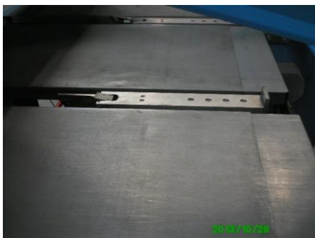
Tafel met aanslagvingers